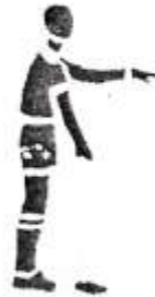
14. Штрафной удар.