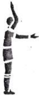
13. Угловой удар.