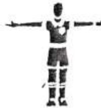
15. Спорный мяч.