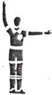
12. Свободный удар.